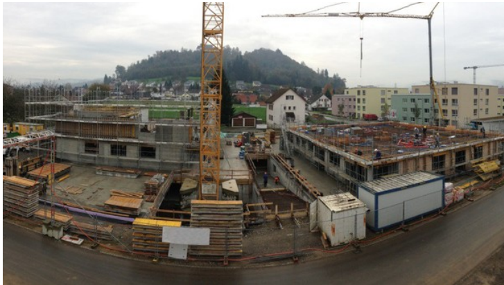
Bauzone Galgenacher: Hier entstehen zwei Mehrfamilienhäuser mit total 21 Mietwohnungen.